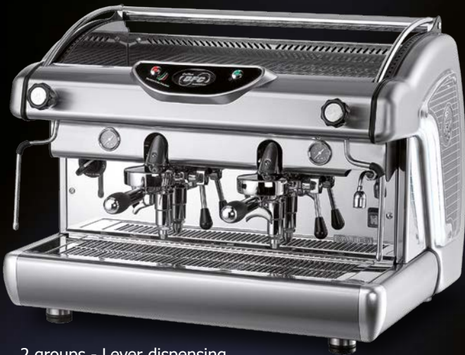
2 groups - Lever dispensing

T.C.I. - control de temperatura independiente Dispositivo electrónico de control de la temperatura de distribución del café con caldera independiente para cada grupo. Caldera para vapor autónoma, con distribución del agua caliente desde el intercambiador de calor.