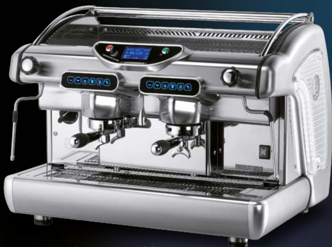
2 groups - Electronic model