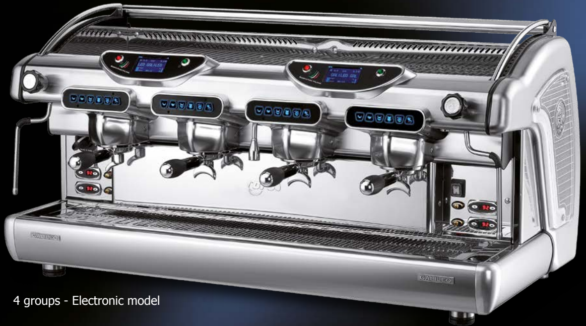
4 groups - Electronic model