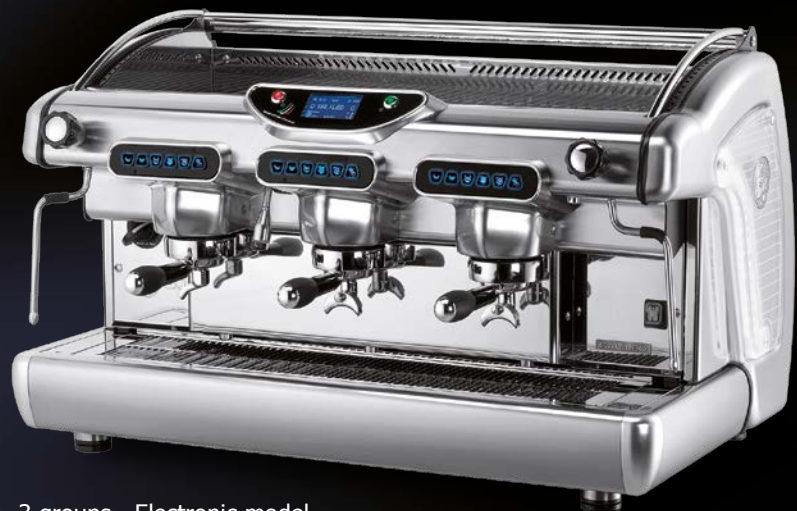
3 groups - Electronic model