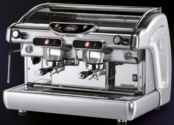
2 groups - Switch model